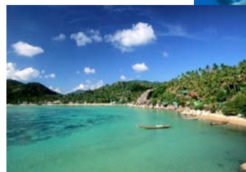
右) タオ島の周囲には、ジンベイザメが泳ぎ回る 下) 穏やかなタオ島のビーチ