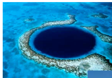
左) ザ・グレートブルーホール。アンバーgris キーから日帰りツアーも 下) カリブ海に面したアンバーgris キーの栈橋