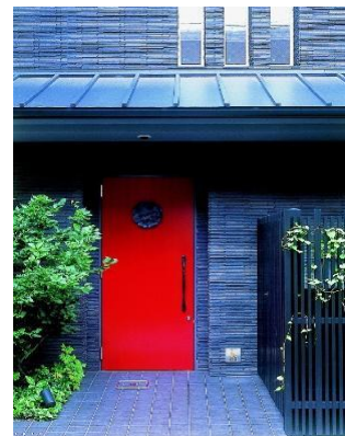
古都京都にある一風変わったエキゾチックな空間