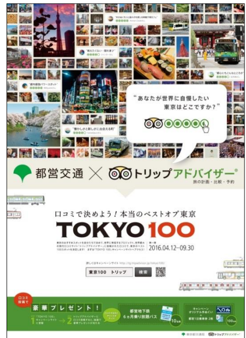
キャンペーンポスター

今後東京を訪れる方々に対し、よりバラエティ豊かに東京の滞在を楽しんでいただけるよう、東京都交通局とトリップアドバイザーは、「TOKYO 100」キャンペーンを通じて、定番の観光地だけでなく、穴場スポットや隠れた名店などを掘り起こし訴求していきます。