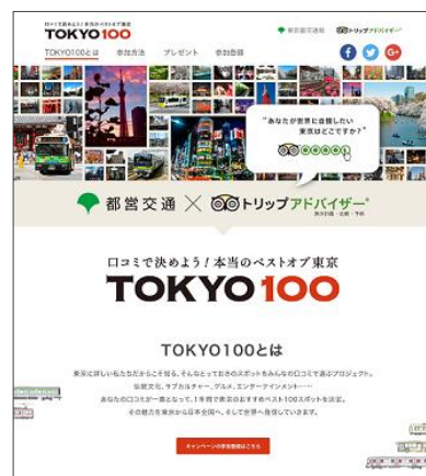
TOKYO 100 特設ページ