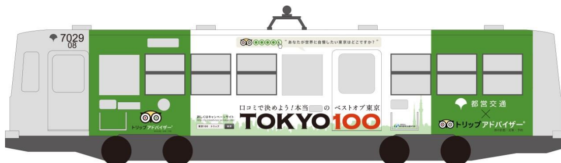
ラッピング都電イメージ