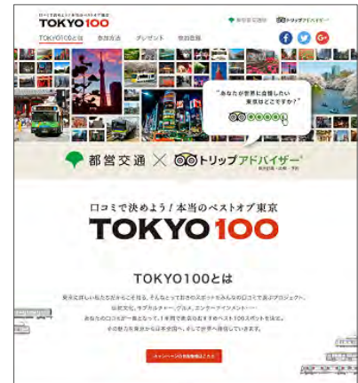
TOKYO 100 特設ページ