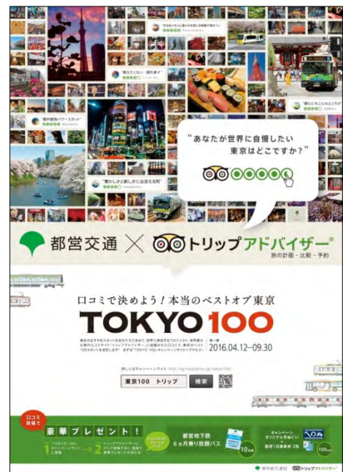
キャンペーンポスター

今後東京を訪れる方々に対し、よりバラエティ豊かに東京の滞在を楽しんでいただけるよう、東京都交通局とトリップアドバイザーは、「TOKYO 100」キャンペーンを通じて、定番の観光地だけでなく、穴場スポットや隠れた名店などを掘り起こし訴求していきます。