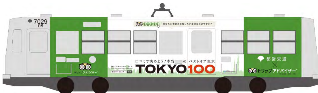
ラッピング都電イメージ