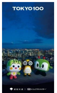
【待ち受け画像】 (イメージ)

注 1 本キャンペーンご応募の際にご記入いただきました個人情報（住所、氏名、電話番号等）は、賞品の発送、応募者、当選者への諸連絡等にごのみ利用させていただきます。