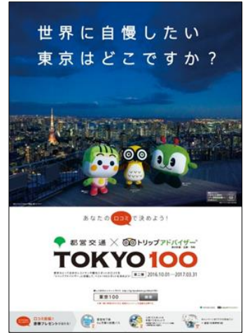
【第二弾キャンペーンポスター】

東京在住や通勤・通学の方などに、東京をよく知る人ならではの視点で、定番だけではない、お気に入りのスポットやディープな横丁、本当は教えたくない名店などをロコミ投稿していただきます。 第一弾、第二弾で投稿されたロコミの数や評価点などをもとに、平成 29 年 4 月以降、最終ランキングとして「TOKYO100」及びグルメ版を決定し、キャンペーン内特設サイトやリーフレットで結果を発表します。キャンペーンに参加し、ロコミ投稿された方には、抽選で都営 6 か月乗り放題パスなど下記の賞品をプレゼントします。