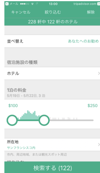
【希望を絞り込んで検索】

本日より、新しい iOS モバイルアプリは世界 48 の国と地域で提供され、近日中には、デスクトップと Android のモバイルアプリ、モバイルサイトでも新たなデザインや機能を利用できるようになります。各アップデートの詳細はトリップアドバイザー日本のオフィシャルブログ ( http://tg.tripadvisor.jp/news/blog/ )にて順次発表してまいります。