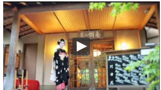
「嵐山 辨慶」のストーリーボード

なお、トリップアドバイザー ビジネスアドバンテージのその他の機能については以下の通りです: