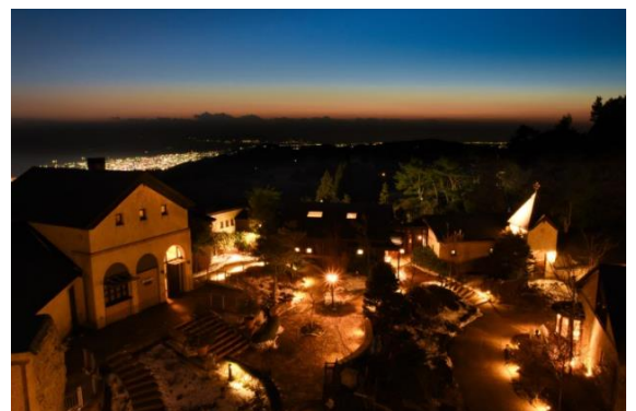
お洒落になった「大井競馬場」もカップルにオススメ

「こじんまりしているけど、おしゃれな神戸やなあ。天気がいいと、見晴台からは神戸の街から、大阪、関西あたりまでが見渡せます。夜ともなれば、光の洪水です。ロマンチックな時間を過ごせます。」という口コミが投稿されていました。