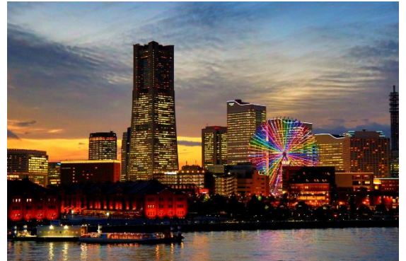
「横浜港大さん橋」からロマンチックな景色

「絶好の写真スポットです。大型客船が停泊していて昼間見る景色も綺麗です。ライトアップされた夜の景色も絵になります。初デートでは必ず訪れるべきでしょう。」という口コミが投稿されていました。