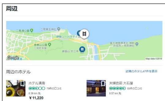
(図1) マップをクリック